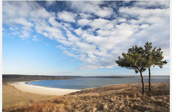
Рис. 1 – Тилігульський лиман